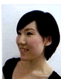
振付 伊藤 南海子