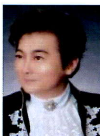
脚本・作曲 安藤 由布樹